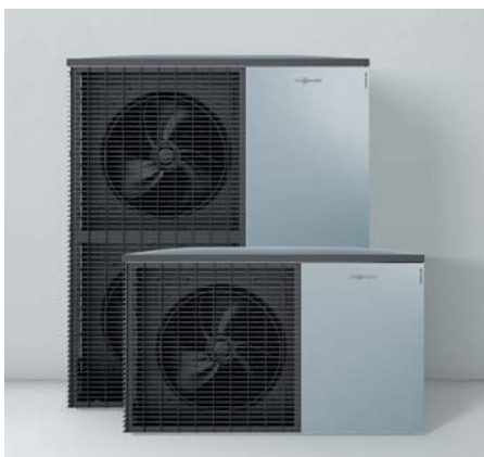
Neue Außeneinheiten im Viessmann Design – Made in Germany