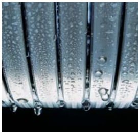
Inox-Radial-Wärmetauscher – langlebig und effizient