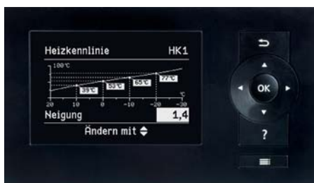
Vitotronic Regelung – einfache Bedienung durch menügeführte Benutzerführung und grafische Darstellungen, wie zum Beispiel der Heizkennlinienanzeige