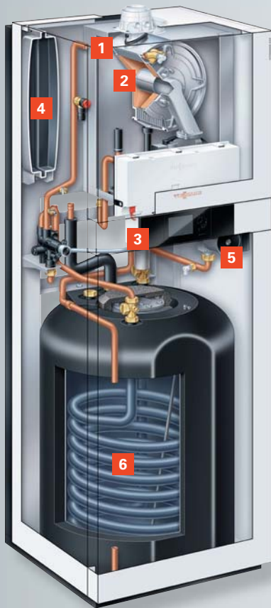
Vitodens 222-F mit emailliertem Rohrwendel-Warmwasserspeicher (Typ B2SA) für Gebiete mit hartem Wasser