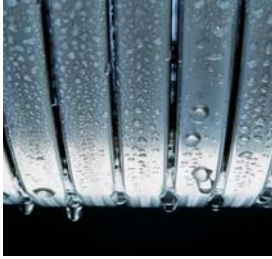
Inox-Radial-Wärmetauscher – langlebig und effizient